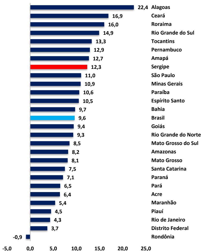
Gráfico 3: Variação acumulada em 12 meses do volume de serviços (%).

Fonte: IBGE - Pesquisa Mensal de Serviços. Elaboração: Observatório de Sergipe.