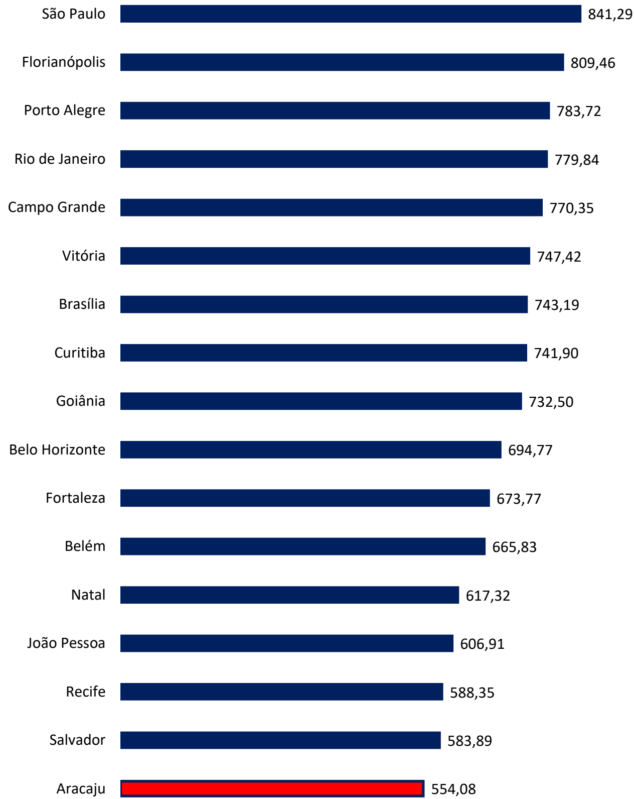
Gráfico 2: Custo Mensal da Cesta Básica das capitais (R$) – Dezembro/2024

A capital que registrou o custo mais baixo foi Aracaju (R$ 554,08), seguida de Salvador (R$ 583,89), Recife (R$ 588,35) e João Pessoa (R$ 606,91). Em contraste, os maiores valores médios foram encontrados em São Paulo (R$ 841,29), Florianópolis (R$ 809,46), Porto Alegre (R$ 783,72), Rio de Janeiro (R$ 779,84) e Campo Grande (R$ 770,35).